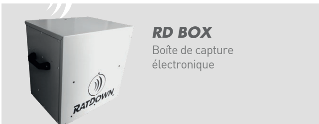
RD BOX Boîte de capture électronique